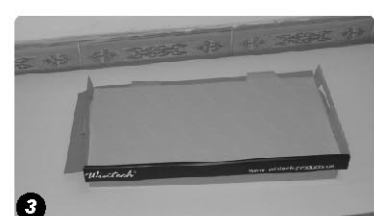
Papiereinlage für jeden Einsatz: falten Sie das Papier entlang der perforierten Linie The paper tray for each layer : Fold the paper tray according to the broken lines