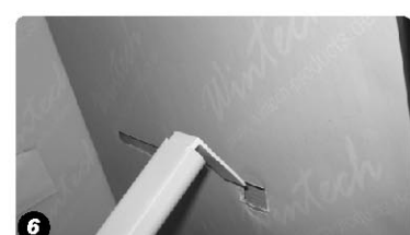
Befestigen Sie den Kunststoffstab auf der Innenseite des Displays in die dafür vorgesehenen Aussparungen. Plastic stick : Insert the plastic stick into the inner side of display stand