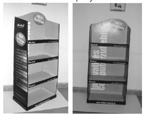
Montage Parts' installation