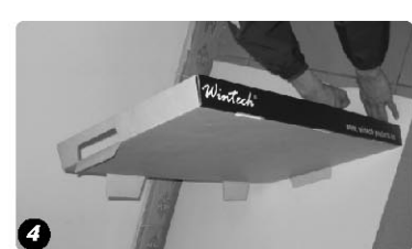
Um den jeweiligen Einsatz leicht befestigen zu können, lassen Sie die Laschen bitte nach unten geklappt The paper tray for each layer : In order to install the paper tray easily, please let the paper clasper downward.