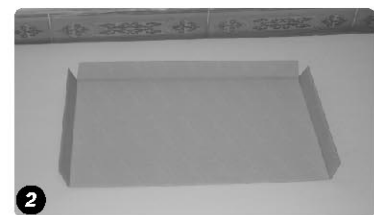
Innerer Bodeneinsatz Inner Bottom Tray