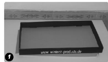
Bodeneinsatz Bottom Tray